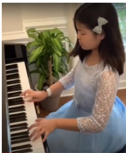
“Σαράντα παλικάρια από τη Λειβαδιά”

Η Ακαδημία Σωκράτη είναι ένα πρωτοποριακό σχολείο, με πολλές διακρίσεις, όπου μαθητές από διαφορετικές εθνικότητες και κουλτούρες βαπτίζονται στην ελληνική παιδεία. Σπουδάζουν την ελληνική γλώσσα και μαθηματικά στα ελληνικά, γνωρίζουν την ελληνική ιστορία και μυθολογία, ενώ παράλληλα μαθαίνουν και βιώνουν τα ελληνικά έθιμα και παραδόσεις.