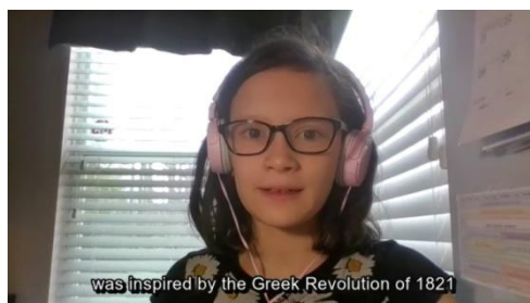
was inspired by the Greek Revolution of 1821