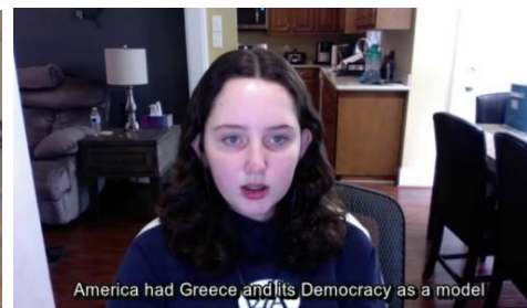
America had Greece and its Democracy as a model

Socrates Academy 200 th Anniversary Celebration of Greek Independence https://www.youtube.com/Socratesacademy-