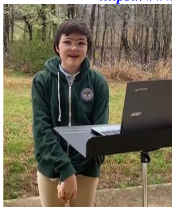
“Έχετε γεια βρυσούλες”

https://www.youtube.com/Socratesacademy-