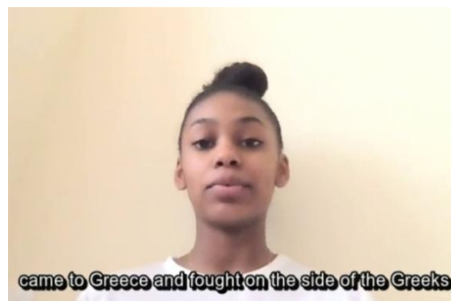
came to Greece and fought on the side of the Greeks