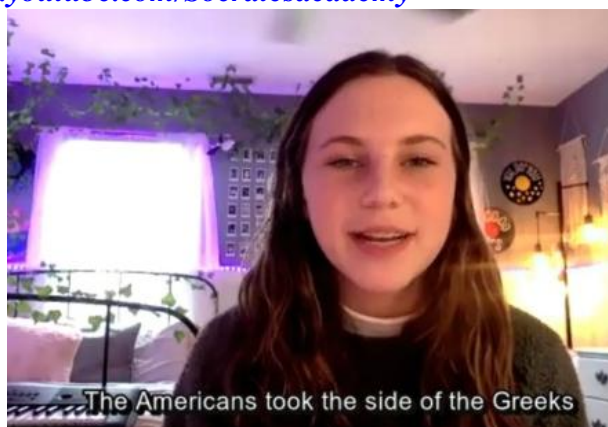
The Americans took the side of the Greeks