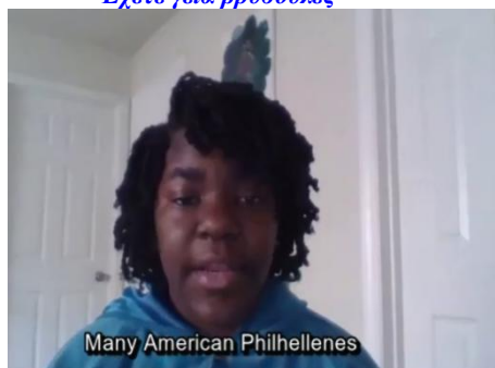
Many American Philhellenes